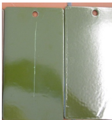
Si 14® E with and without cut BEFORE testing Si 14® E mit und ohne Schnitt VOR dem Test

The width of the cut has not exceeded 1mm.